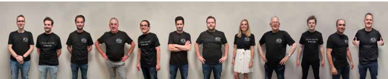
Féju team SPAR StorePC